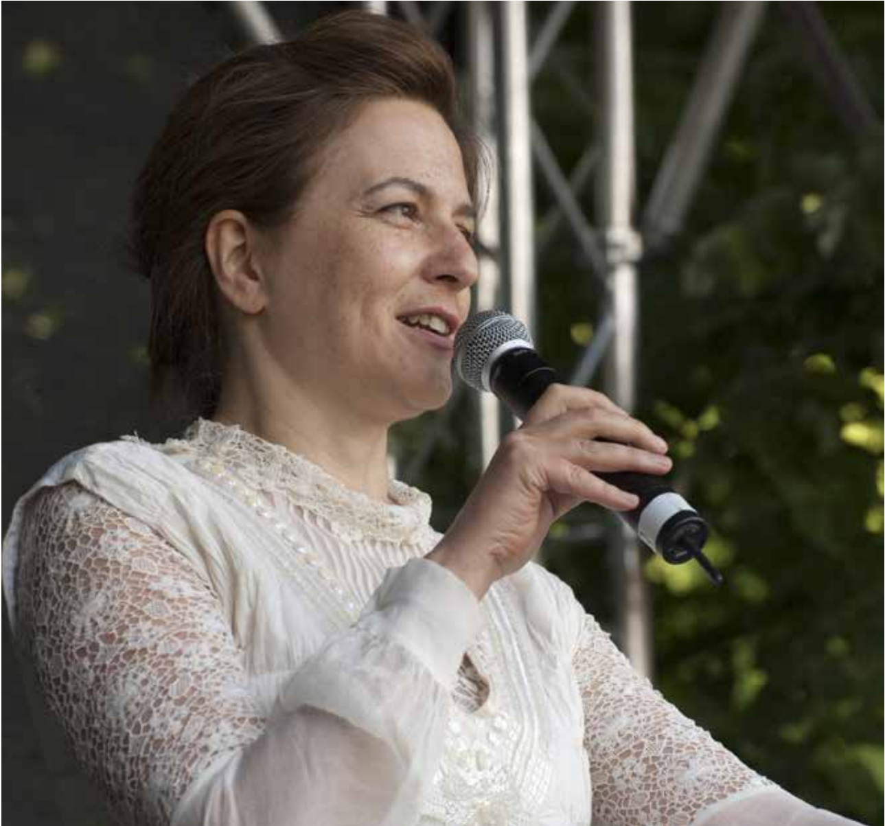
Martina Gedeck liest Gedichte und Briefe der Annette von Droste-Hülshoff und formuliert ihre Sicht auf die Autorin.