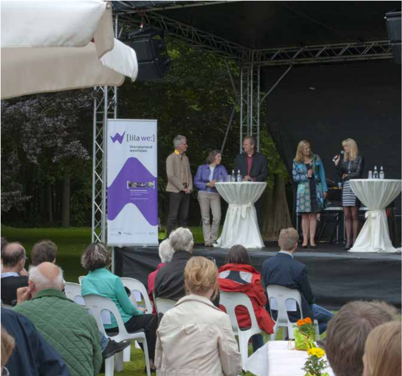
Eröffnung des Westfälischen Droste-Sommers 2013 auf Burg Hülshoff